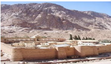
Monastero of St. Catharine