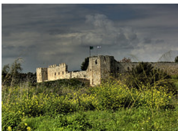
Fortezza Dei Crociati

benedizione degli anelli. Poi proseguiremo per le Altire del Golan fino al Monte Hermon, dove nasce il fiume Giordano. Visiteremo Cesarea Filippi dove San Pietro proclamò Gesù come il Cristo e proseguiremo per Yardenit, il luogo dove Giovanni Battista ha battezzato Gesù nel Giordano. Cena e pernottamento a Tiberiade.