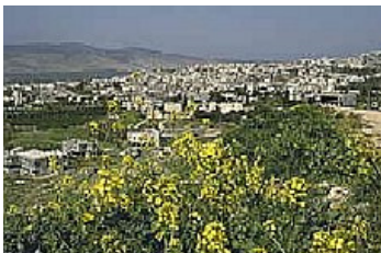
Cana of Galilee

Giorno 10: Tiberiade - Cafarnao – Tabgha – Tiberiade. Dopo la colazione, visita di Tiberiade, città fondata nel 26 a.D. da Erode Antipas in onore dell'Imperatore Tiberio. Poi saliremo sul Monte delle Beatitudini per celebrare la santa Messa. Proseguimento per Cafarnao per visitare la casa di S. Pietro e la Sinagoga costruita dal centurione al quale Gesù aveva guarito il servo. Poi proseguiremo per Tabgha, luogo in cui Gesù moltiplicò i pesci e i pani. Visita alla chiesa della Moltiplicazione, alla chiesa del primato di Pietro e alla Mensa Cristi, dove Gesù risorto ha condiviso la cena coi suoi discepoli. Poi attraverseremo il Lago di Tiberiade in nave arrivando al ristorante dove potremo assaggiare il famoso pesce di S. Pietro. Cena e pernottamento a Tiberiade