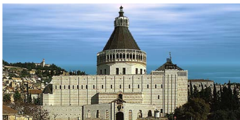
Basilica of the Annunciation

Giorno 9: Betlemme – Betania – Gerico - Ein Karim – Tiberiade. Dopo colazione, visita di Betlemme. Qui visiteremo la Basilica della Natività e celebreremo la santa Messa. Visita alla Grotta di S. Girolamo e il campo dei pastori. Poi proseguiremo per Betania, dove abitava Lazzaro, con le sorelle Maria e Marta. Qui visiteremo la casa e la tomba di Lazzaro. Poi proseguiremo per una visita di Gerico nella Giudea, dove Gesù guarì il cieco Bartimeo e visita alla fontana del profeta Eliseo. Chiuderemo la giornata con una visita di Ein Karim, dove nacque Giovanni Battista. Qui visiteremo la Chiesa della Visitazione costruita sul luogo dove la Madonna visitò la cugina Elisabetta e la casa di Elisabetta e Zaccaria. Cena e pernottamento a Tiberiade